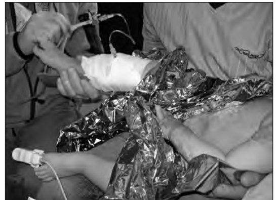
Abbildung 3: Fixierung und Nutzung eines Drei-Wege-Hahnes mit kurzer Schlauchleitung zur Vermeidung einer Dislokation der intraossären Nadel.